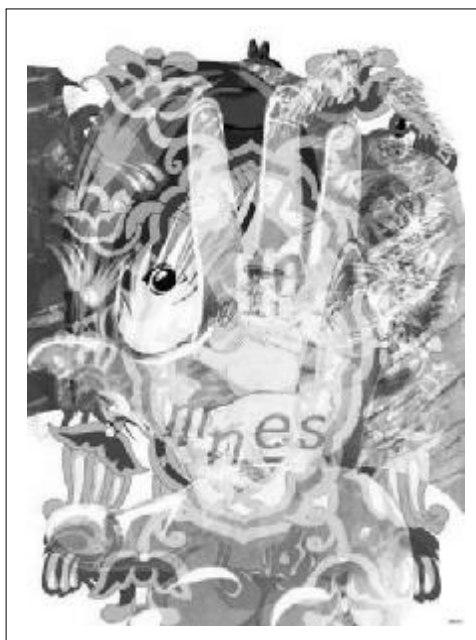
Fig. 4. Omnes , travail digital (auteure: Ana-Maria Ovadiuc, INFO ART USV, no. 4, mai 2013, p.11)