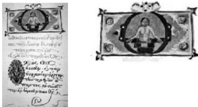
Fig. 2. Page illustrée avec frontispice (le manuscrit Liturgie du Saint Jean Chrysostome , 1620 – Musée National d'Art de Roumanie)

Les lettres Δ, Θ, Α, Κ et Τ résonnent avec l'espace culturel et religieux, ayant des formes et des motifs décoratifs rares. Tout en étudiant le rapport entre la forme et le contenu, on identifie la présence de la lettre Thetha Θ qui symbolise la mort, selon le nom du dieu Thanatos 1 .