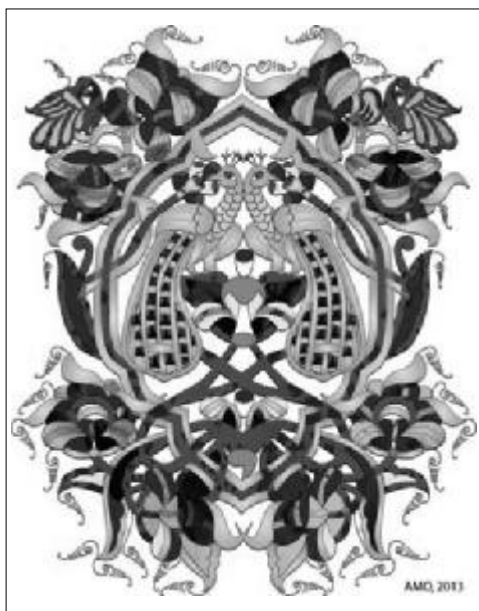
Fig. 5. Illustration de la lettre O (interprétation digitalisée d'après le manuscrit 23, auteur le hiéromoine Calinic, La Liturgie du Saint Jean Chrysostome – manuscrit de Constantin Brâncoveanu, Musée National d'Art de Roumanie)