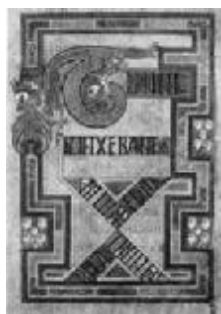
Fig.1. Page illustrée avec la lettre X, dans la Bible de Kells (Dublin, Irlande)

«La référence à Chi dans ces contextes représentationnels réitère le sens que non seulement la première lettre du nom de Christ était significative, mais tout particulièrement le visage et la position du corps, sa mort et, en même temps, sa nature cosmique» (Ben C. Thilghman).